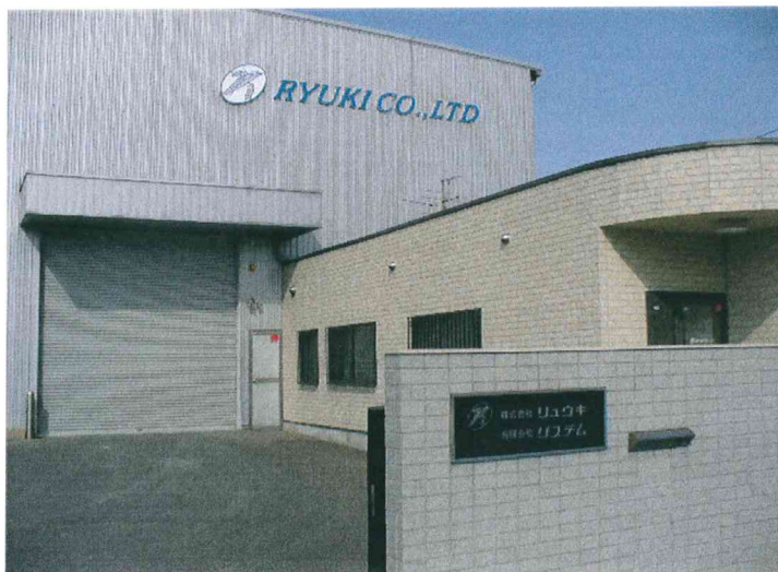
株式会社 リュウキ 入口